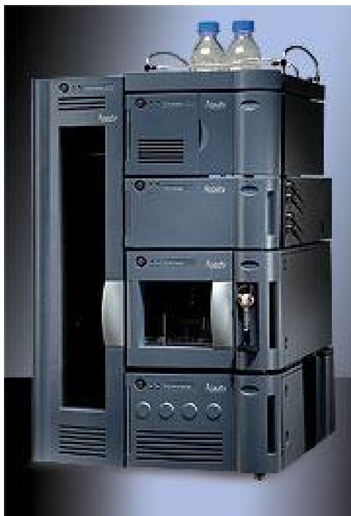
Рис. 1. Внешний вид хроматографа жидкостного Waters Acquity UPLC.

Бинарный градиентный насос ACQ-BSM предназначен для подачи двух потоков элюента (всего имеется четыре линии). Подающие головки насоса снабжены датчиками давления, по показаниям которых процессором сглаживаются пульсации потока элюента.