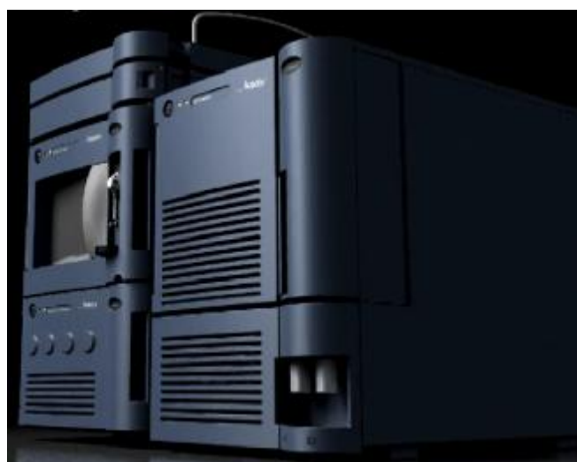
Рис. 6. Внешний вид масс-спектрометрического детектора с тандемным квадруполем Acquity TQD