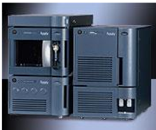
Рис. 7. Внешний вид масс-спектрометрического детектора Acquity SQD