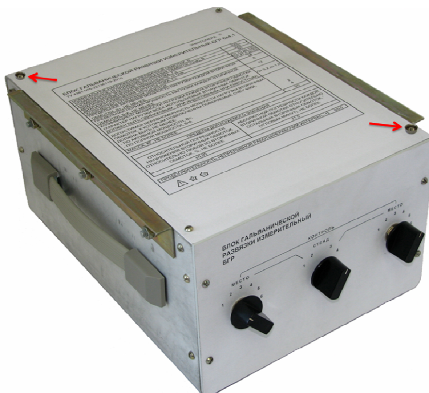
Фото 1 – Общий вид БГР 6х4.Z и места клеймения после поверки