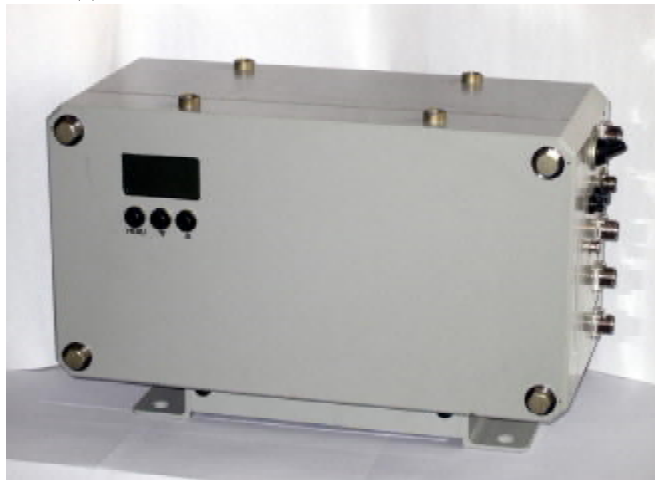
Рисунок 1 – Фото блока БДАС-04Р.

Спектрометрическая информация и данные о расходе и объеме отобранной пробы используются для расчета результатов измерений ОА. Расчеты выполняются основным процессором блока детектирования и выдаются по запросу устройств верхнего уровня по каналам связи, а также выводятся на ЖКИ.