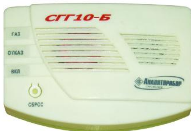
Рисунок 1 - Внешний вид сигнализатора:

Схема пломбировки от несанкционированного доступа приведена на рисунке 2.