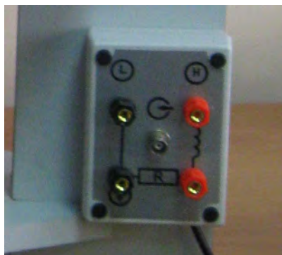
Рисунок 2 – Панель разъемов ● - место пломбирования от несанкционированного доступа