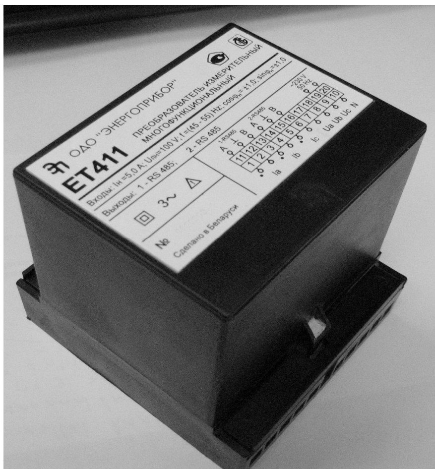
Рисунок 1 – Внешний вид преобразователя измерительного многофункционального ET