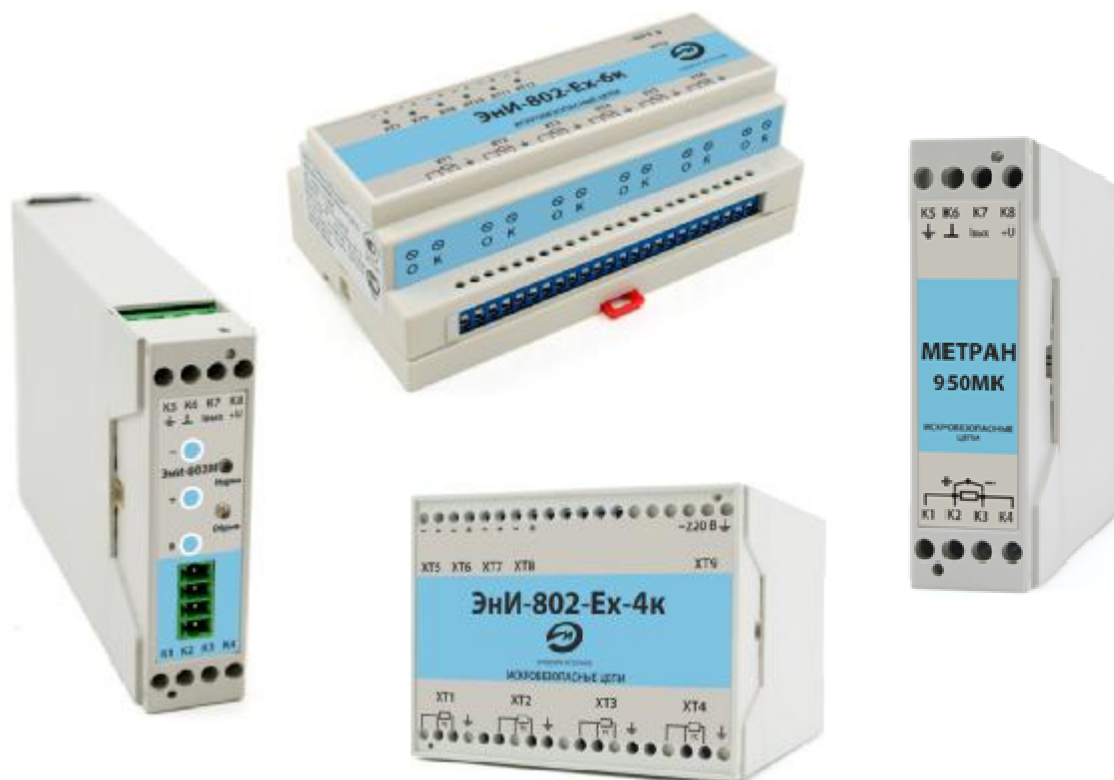
Рисунок 1 - Внешний вид ПИ

Защита ПИ от несанкционированного вскрытия обеспечивается нанесением клейма (пломбы) на корпус ПИ. Пломба представляет собой саморазрушающуюся наклейку, которая наносится в месте соприкосновения основания и крышки корпуса. Схема пломбировки представлена на рисунке 2.