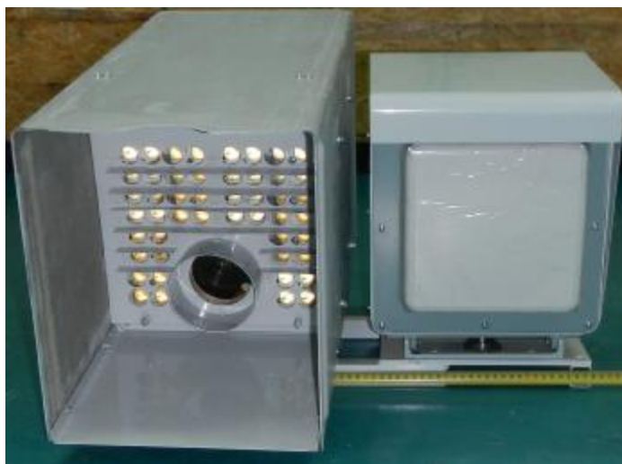
Рисунок 1 - Внешний вид комплекса

Внешний вид комплекса контроля дорожного движения автоматизированного стационарного ККДДАС-01СТ «Стрелка-СТ» и место пломбировки показаны на рисунках 1, 2.