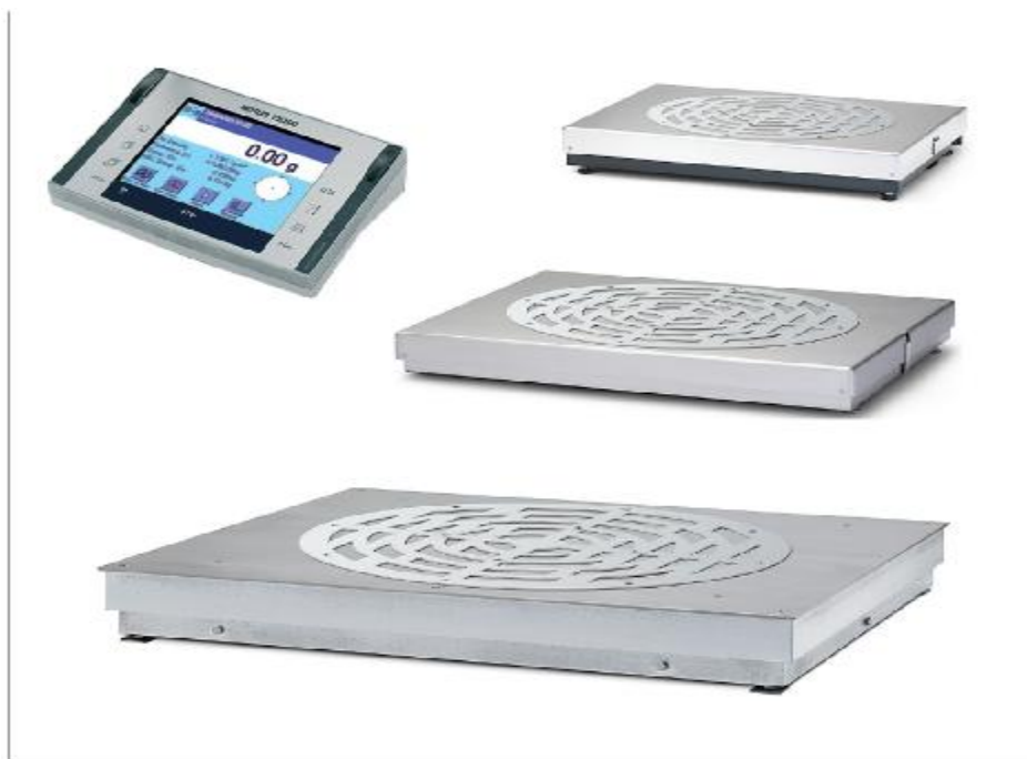
Рисунок 1 - Внешний вид весов электронных ХР-К

Весы имеют следующие устройства и функции: