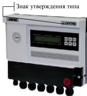
Корректор СПГ762. Общий вид.