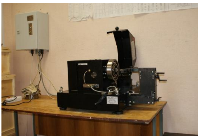
Рисунок 1 – Внешний вид стенда вибрационного контроля подшипников СВК-А

Внешний вид стенда вибрационного контроля подшипников СВК-А приведен на рисунке 1, структура стенда приведена на рисунке 2.