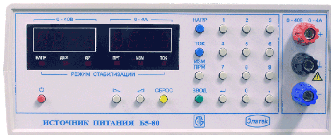
Рисунок 1. Внешний вид ИП.