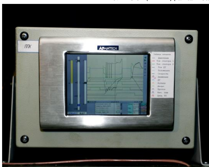
Рис. 3 Общий вид панельного компьютера РПУ-03.1, РПУ-03.2