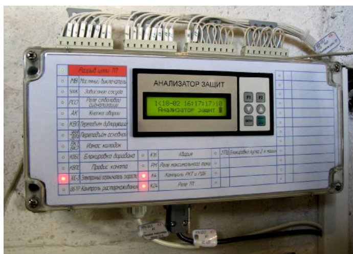
Рис. 2 Общий вид анализатора защит Анз-03