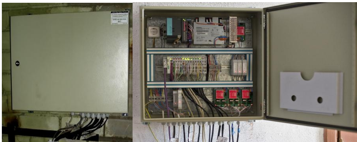
Рис. 1 Общий вид шкафа контроллера