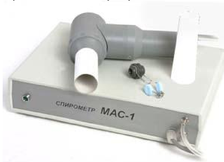
Рисунок 2 – Внешний вид спирометра MAC-1-ПК