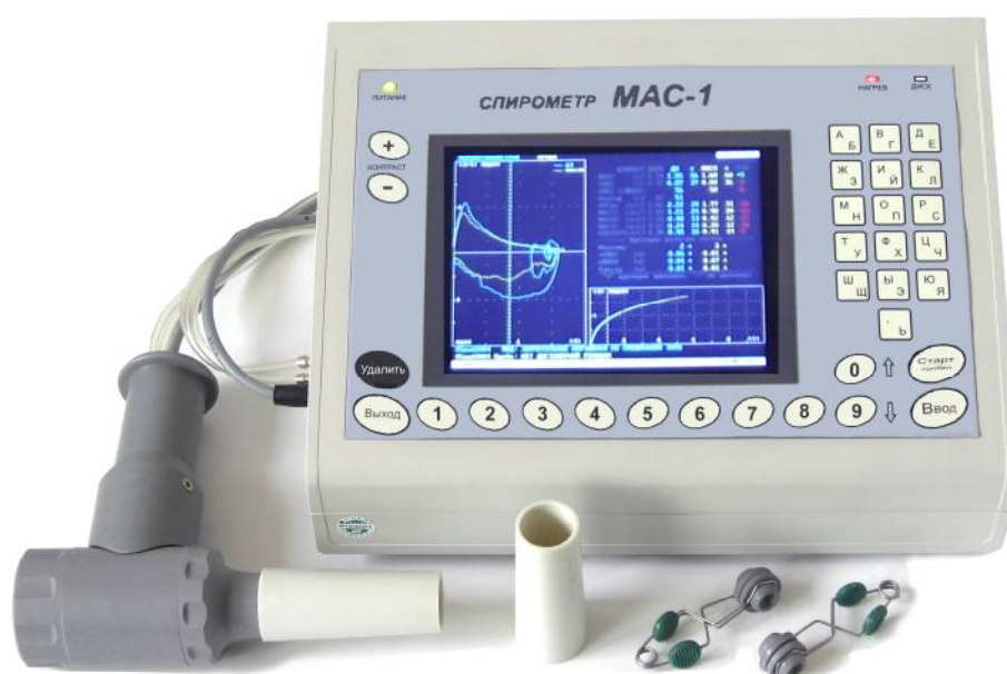
Рисунок 1 – Внешний вид спирометров MAC-1-А и MAC-1-ВГА