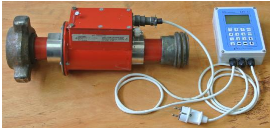
Рисунок 1 - Общий вид расходомеров РЭМ