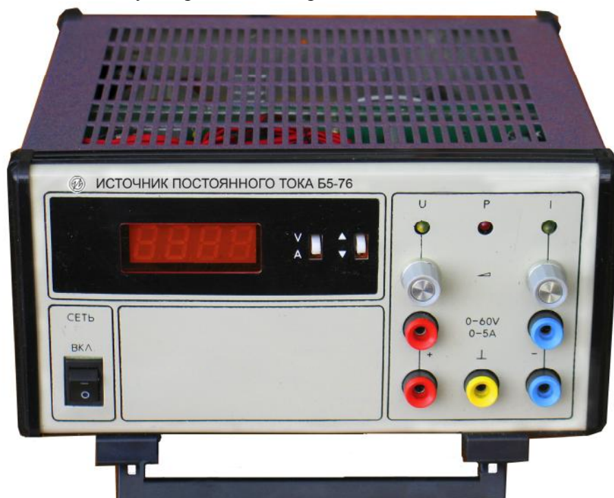
Рис. 1 Внешний вид источника постоянного тока Б5-76.

Внешний вид источника Б5-76 показан на рис. 1, места клеймления и пломбировки от несанкционированного доступа приведены на рис. 2.