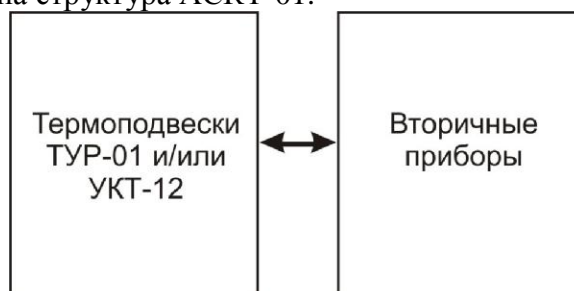
Рис.1. Структура системы

На рис.1 представлена структура АСКТ-01.