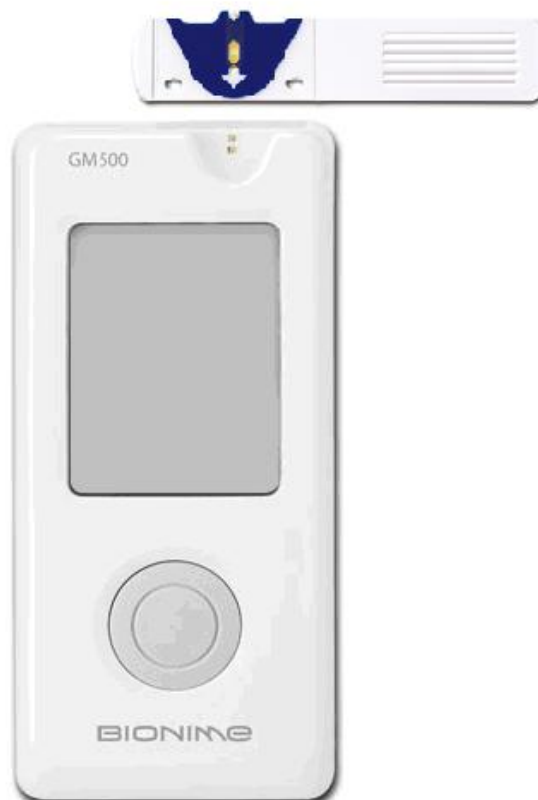
Рисунок 3 – Общий вид глюкометра модели GM-500