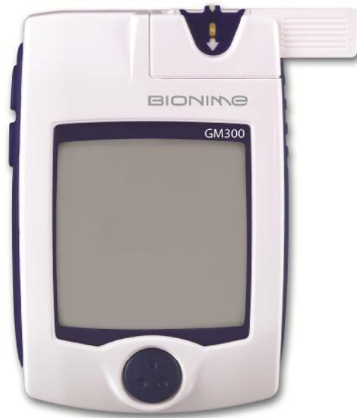
Рисунок 2 – Общий вид глюкометра модели GM-300