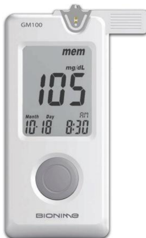
Рисунок 1 – Общий вид глюкометра модели GM-100

Глюкометры выпускаются в следующих вариантах: модель GM-100, модель GM-300, модель GM-500.