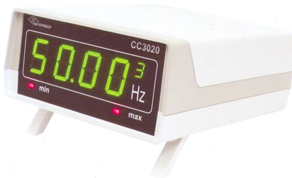
Рисунок 2. Общий вид частотомера СС3020-Н