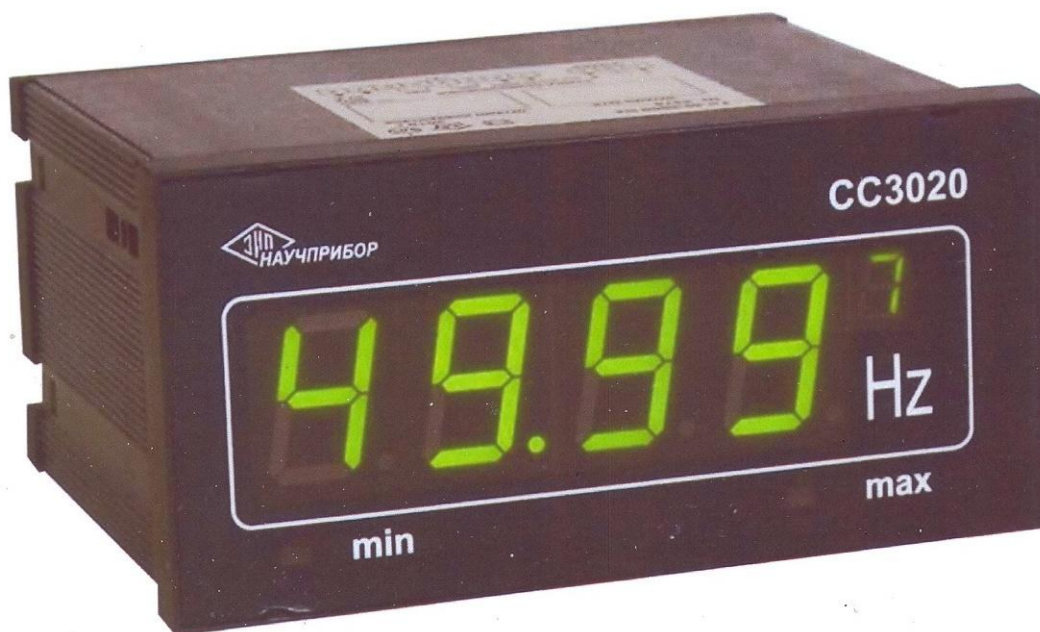
Рисунок 1. Общий вид частотомера СС3020-Щ