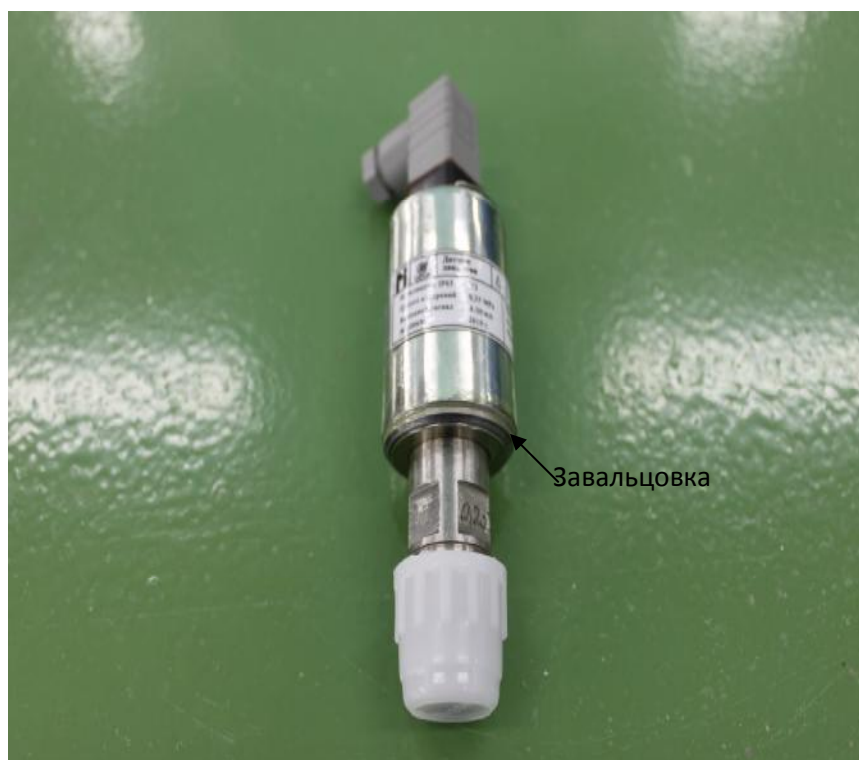
Рисунок 2 – Место завальцовки