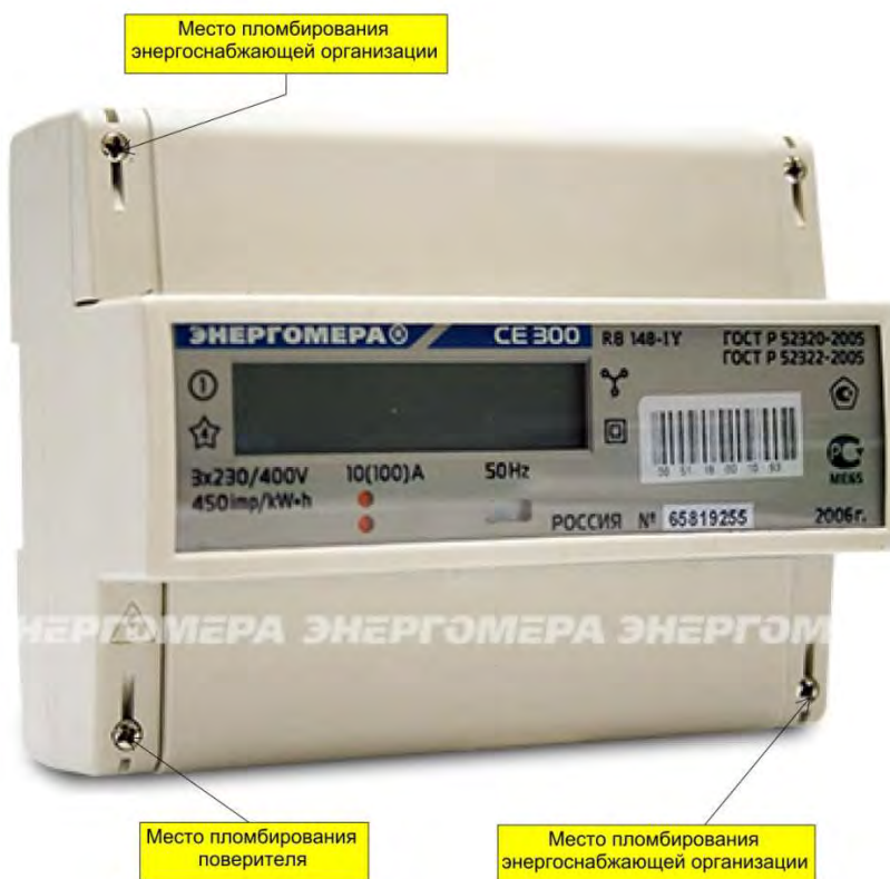
Рисунок 3 – Общий вид счетчика CE300 R31