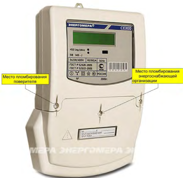
Рисунок 2 – Общий вид счетчика CE300 S33