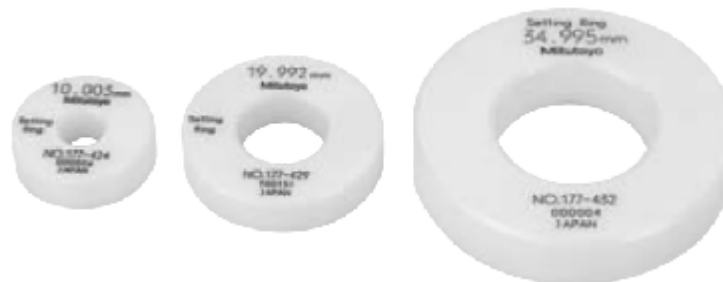
Рисунок 2 - Общий вид колец серии 177 из керамики