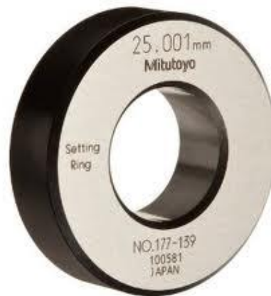
Рисунок 1 - Общий вид колец серии 177 из стали

Кольца поставляются в комплектах или в виде отдельных колец. В диапазоне диаметров от 4 до 45 мм возможна поставка как стальных (рис. 1), так и керамических (рис. 2) колец.