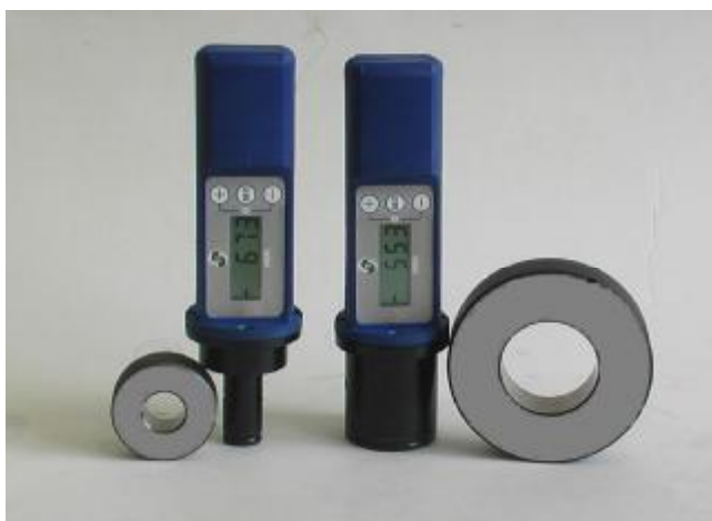
Рисунок 1 – Общий вид приборов электронных ЦДЗ исполнений от ЦДЗ.00.00.000-00 до ЦДЗ.19.00.000-99

Диаметры установочных колец, входящих в комплект прибора, определяются в соответствии с документом «Методика выбора диаметров установочных (эталонных) колец, используемых для поверки и контроля работоспособности приборов типа ЦДЗ».