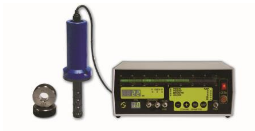
Рисунок 4 – Общий вид приборов электронных ЦДЗ исполнений от ЦДЗ.40.00.000-00 до ЦДЗ.59.00.000-99