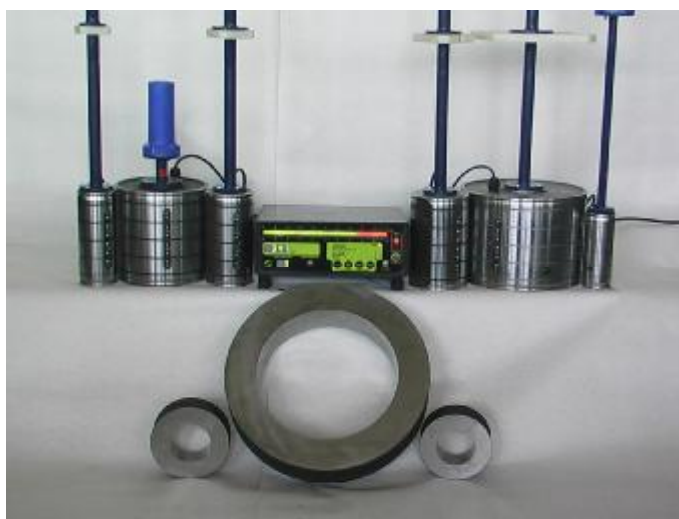
Рисунок 5 – Общий вид приборов электронных ЦДЗ исполнений от ЦДЗ.40.00.000-00 до ЦДЗ.59.00.000-99