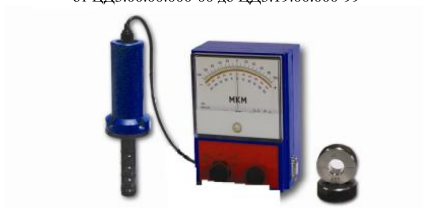
Рисунок 3 – Общий вид приборов электронных ЦДЗ исполнений от ЦДЗ.20.00.000-00 до ЦДЗ.39.00.000-99