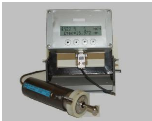
Рисунок 6 – Общий вид приборов электронных ЦДЗ исполнений от ЦДЗ.60.00.000-00 до ЦДЗ.79.00.000-99