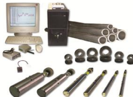
Рисунок 7 – Общий вид приборов электронных ЦДЗ исполнений от ЦДЗ.80.00.000-00 до ЦДЗ.89.00.000-99