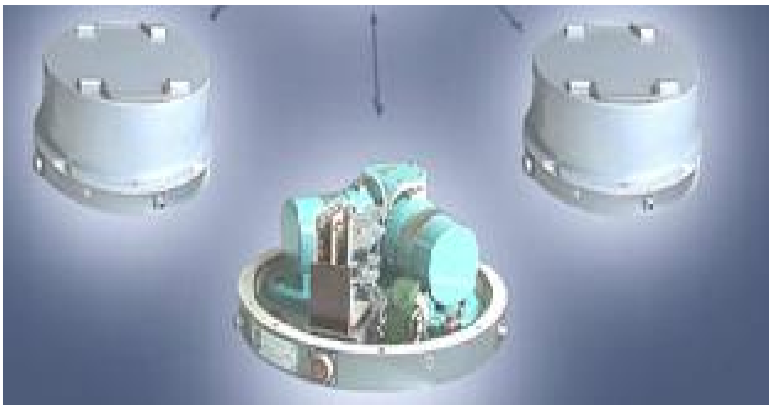
Рисунок 1 – Общий вид системы