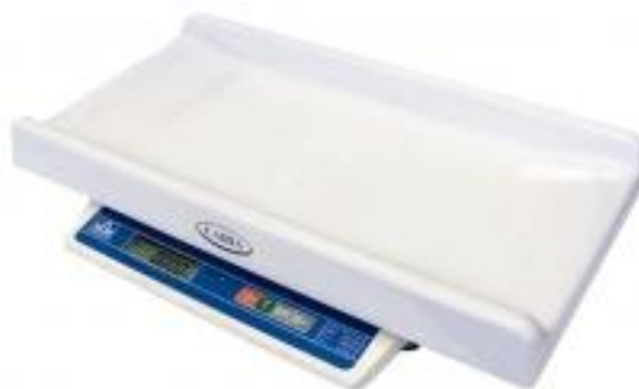
Рис. 1 – Общий вид весов

Питание весов осуществляется от встроенного аккумулятора.