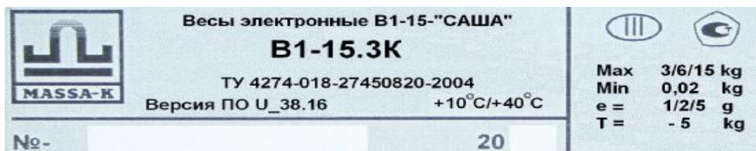
Рис. 3 – Маркировка весов

Маркировка весов производится на фирменной, разрушающейся при снятии планке. На которой нанесено: