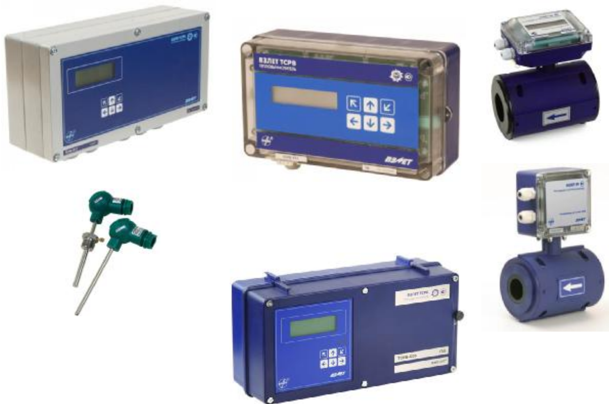
Рисунок 1 - Общий вид теплосчетчиков - регистраторов «ВЗЛЕТ ТСР-М»

Общий вид теплосчетчиков приведен на рисунке 1.