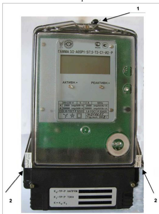
1 – пломба поверителя; 2 – места обклейки гарантийными наклейками завода-изготовителя. Рисунок 1.

На рисунке 1 представлено фото общего вида счетчика ГАММА 3 с указанием мест пломбировки и наклеек.