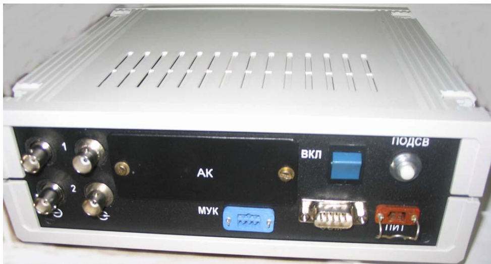
Рисунок 1б. Общий вид прибора измерительного «ПОИСК – 2М» (задняя панель)