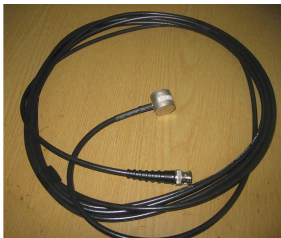
Рисунок 1в. Общий вид пьезоэлектрического виброизмерительного преобразователя