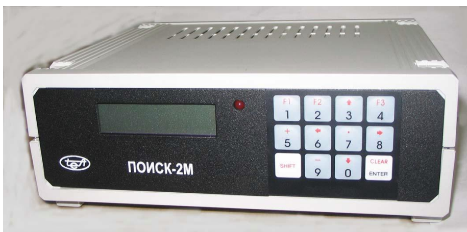
Рисунок 1а. Общий вид прибора измерительного «ПОИСК – 2М» (передняя панель)

Прибор измерительный «ПОИСК–2М» обеспечивает обнаружение и регистрацию развития трещин в оболочке оборудования в двух режимах: энергетическом и импульсном.