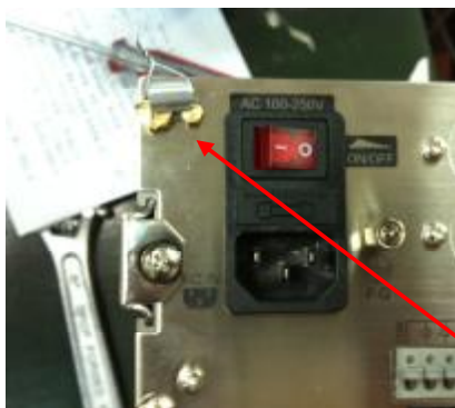
CI-501, CI-502, CI-503, CI-505, CI-507