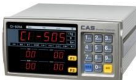
CI-503, CI-505, CI-507