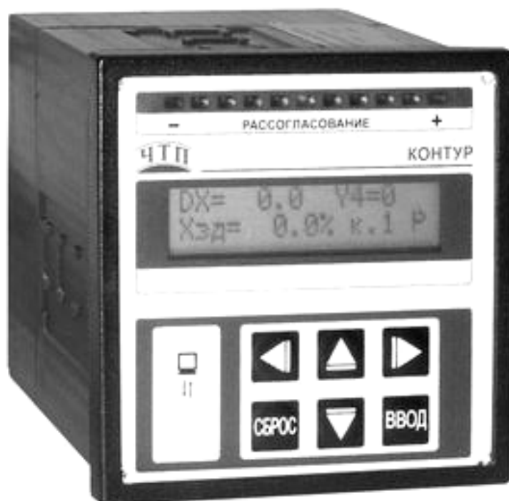
Рисунок 1 – Общий вид регулятора