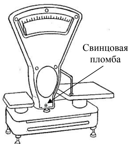
Рисунок 3 – Схема пломбировки весов

Для защиты от несанкционированного доступа к внутренним частям и изменений параметров их настройки и юстировки, корпус весов пломбируется свинцовой пломбой (рисунок 3).