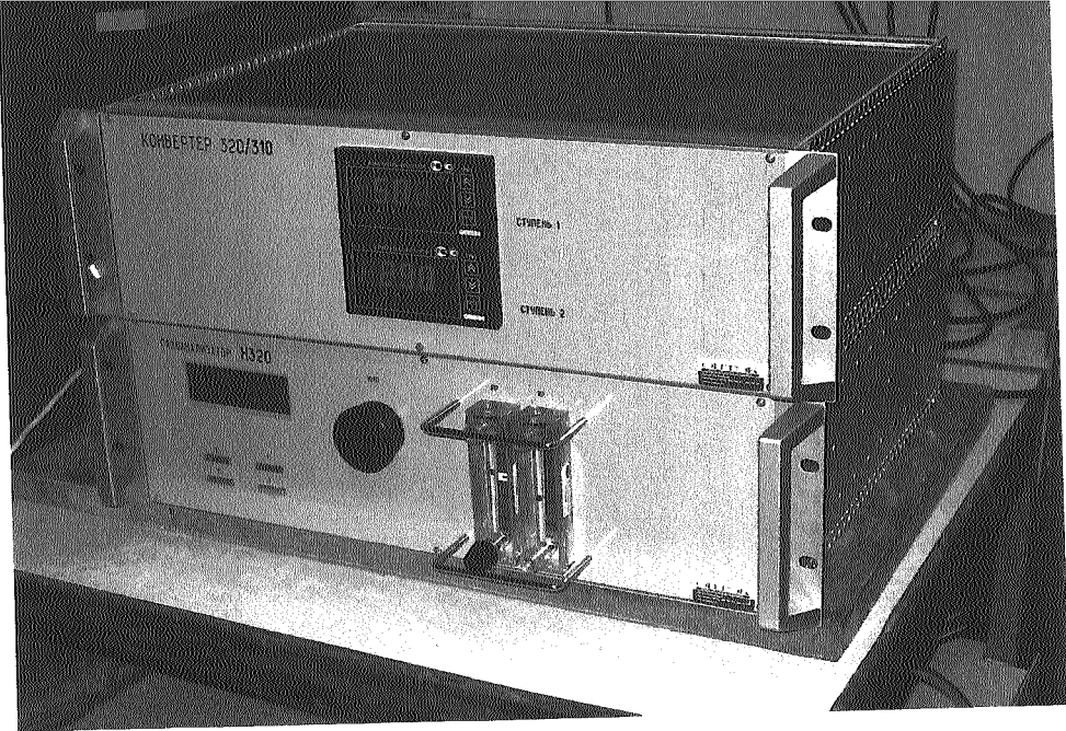
Блок конвертер Н-320