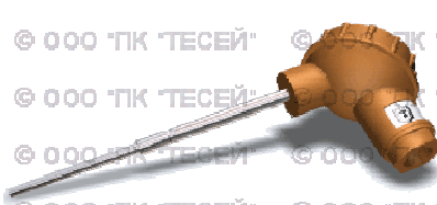
Рис.2 — ТСПТК 102