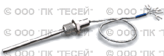
Рис.4 — ТСПТК 202