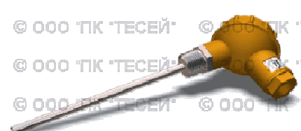
Рис.3 — ТСПТК 201