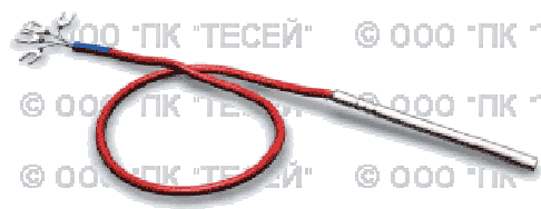
Рис.5 — ТСПТК 300