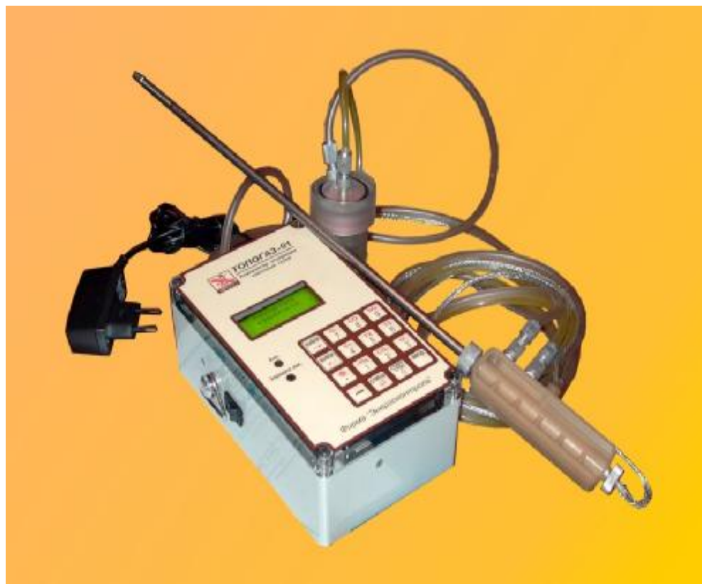
Рис.2 Общий вид газоанализатора «Топогаз-01»

ФК – фильтр грубой очистки с конденсатосборником; CO, NO, O 2 – электрохимические датчики для измерения концентрации кислорода, оксидов углерода и азота; dP – датчик давления; T 1 , T 2 – датчики температуры.