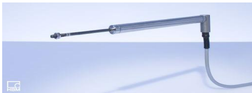
Рисунок 1 Внешний вид датчика перемещений индуктивного WAx/L с плунжером

На рисунке 1 показан внешний вид датчика перемещений индуктивного WAx/L с плунжером, а на рисунке 2 - внешний вид датчика перемещений индуктивного WA с измерительным щупом