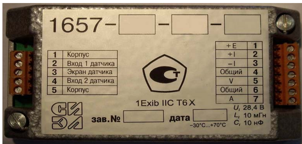
Рисунок 2 Внешний вид усилителя СИЭЛ-1657