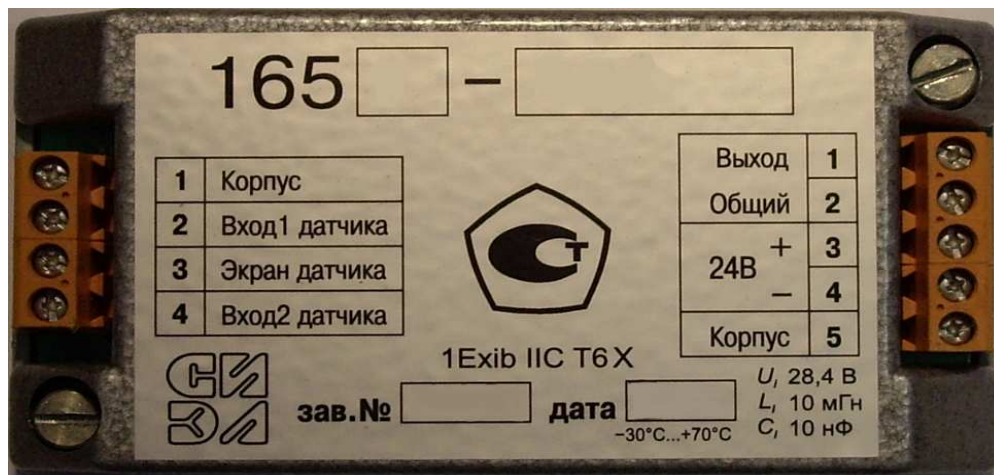
Рисунок 1 Внешний вид усилителей СИЭЛ-1651-СИЭЛ-1656