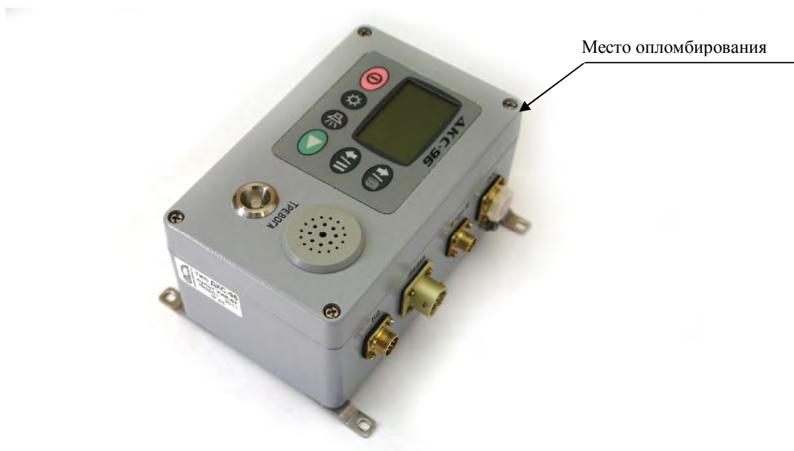
Рисунок 1г – Измерительный пульт УИК-07

Все технические средства, входящие в состав дозиметров-радиометров, опломбированы от несанкционированного доступа в соответствии с конструкторской документацией.