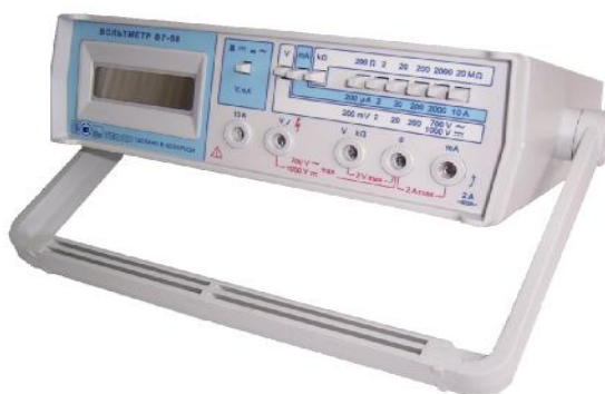
Рисунок 1 – Общий вид вольтметров

Общий вид вольтметров приведен на рисунке 1.