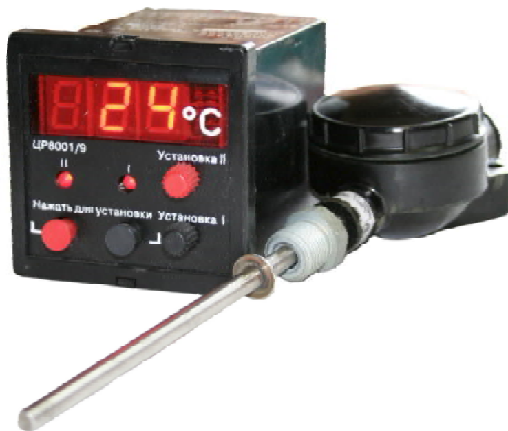
Рисунок 1 – Внешний вид измерителя

На рисунке 2 указана схема указания мест расположения клейма ОТК и клейма (наклейки) поверителя на измеритель.